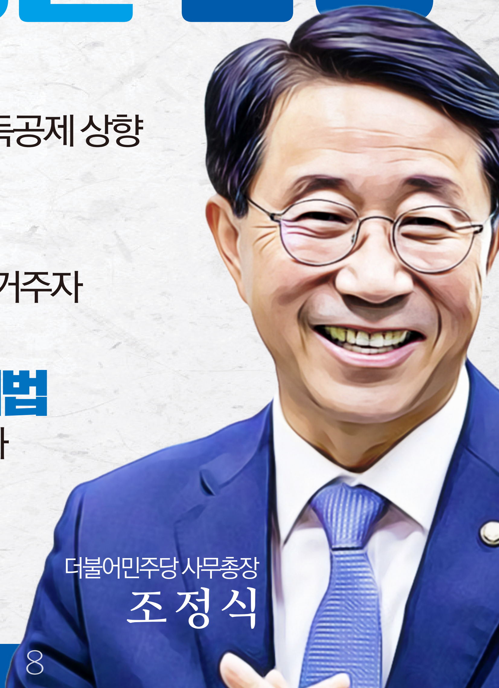
더불어민주당 사무총장 조정식